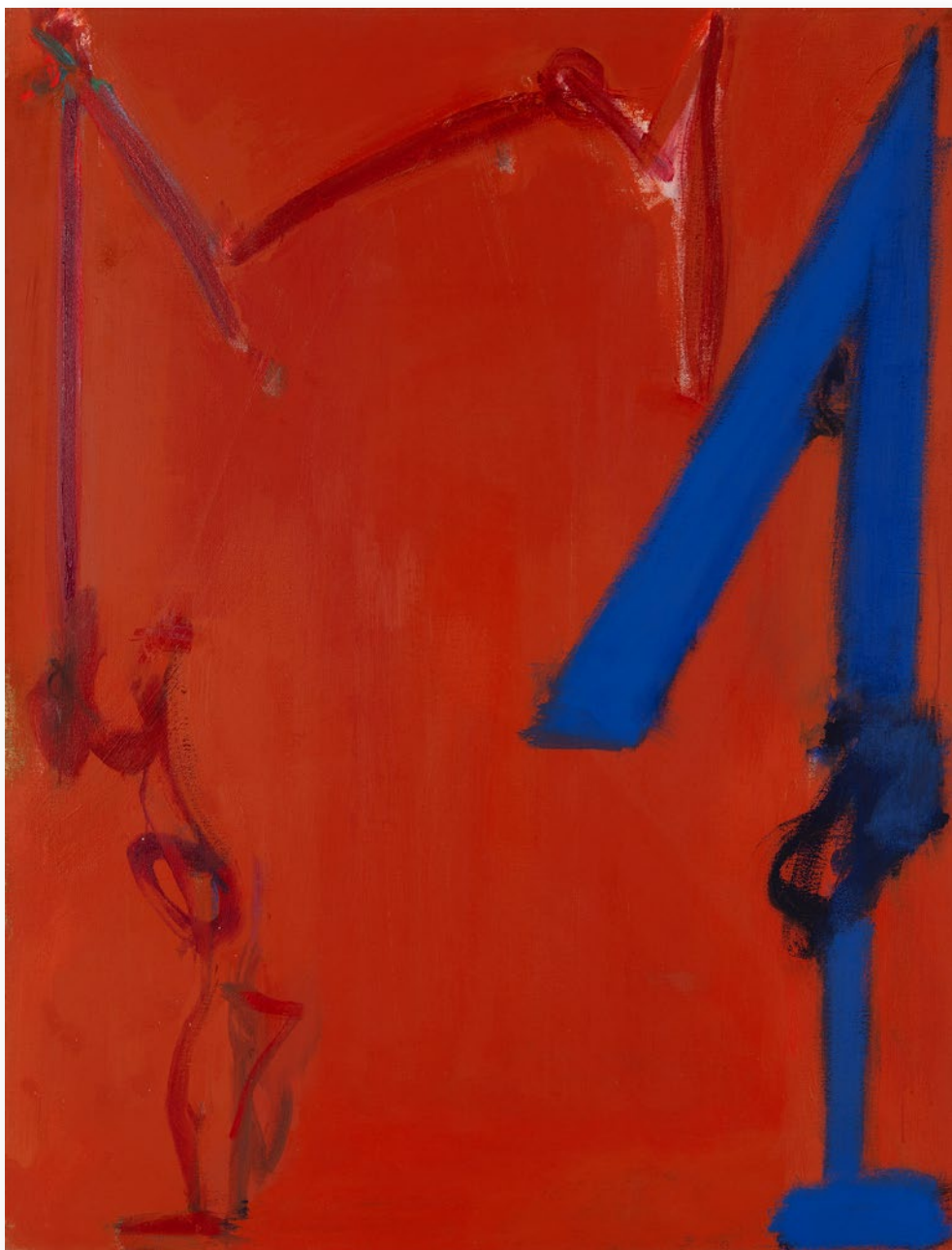
Work 97-I 作品97-I

1997 / Acrylic on canvas 165.0×127.5cm アクリル