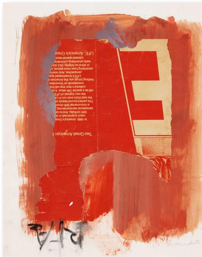
Untitled No.1 無題No.1

1989 / Watercolor and collage on paper 47.3×37.2cm 水彩、コラージュ