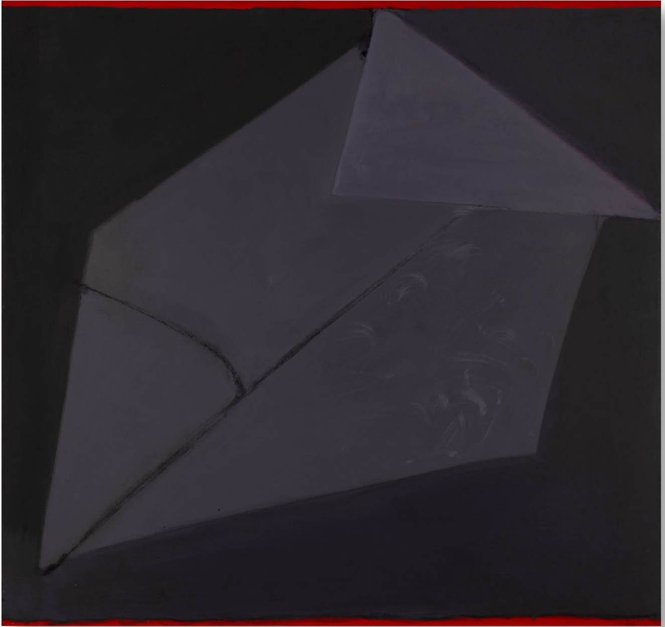
Form in Black No.2 黒の中のフォルム No.2

1973 / Acrylic on canvas 183.0×173.0cm アクリル