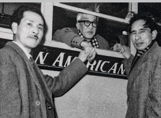
1949年、パリにて、岡田謙三、藤田嗣治、川端実。 Okada Kenzo, Fujita Tsuguharu, and Kawabata Minoru in Paris, in 1949 1949年、岡田謙三、藤田嗣治と川端実が合写したパリ。

川端は、自らの内面にある心理的風景を、絵画という視覚言語に結晶化させようとした。濃密な色面の広がりの中に象徴的な形が浮かび上がる構成や、対比色のストロークによる抒情的な強度は、抽象表現主義やカラーフィールド・ペインティングと共鳴しつつも、東洋的精神性と造形感覚が融合した独自の世界を形成。戦後日本の抽象美術を国際的に展開した先駆者として、現在もその業績は高く評価されている。