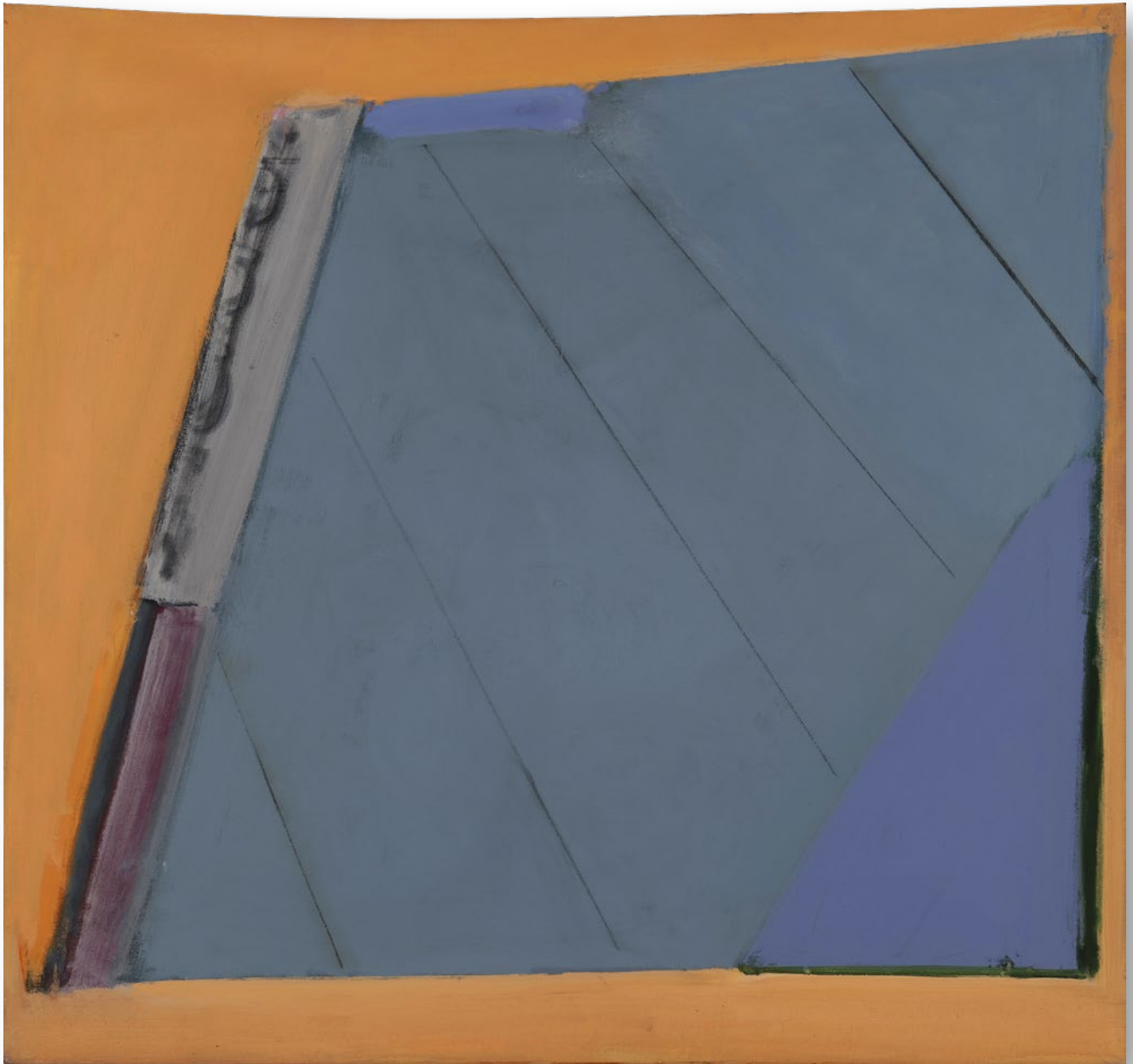
Form Unity No.3 統一体 No.3

1976 / Acrylic on canvas 173.0×183.0cm アクリル