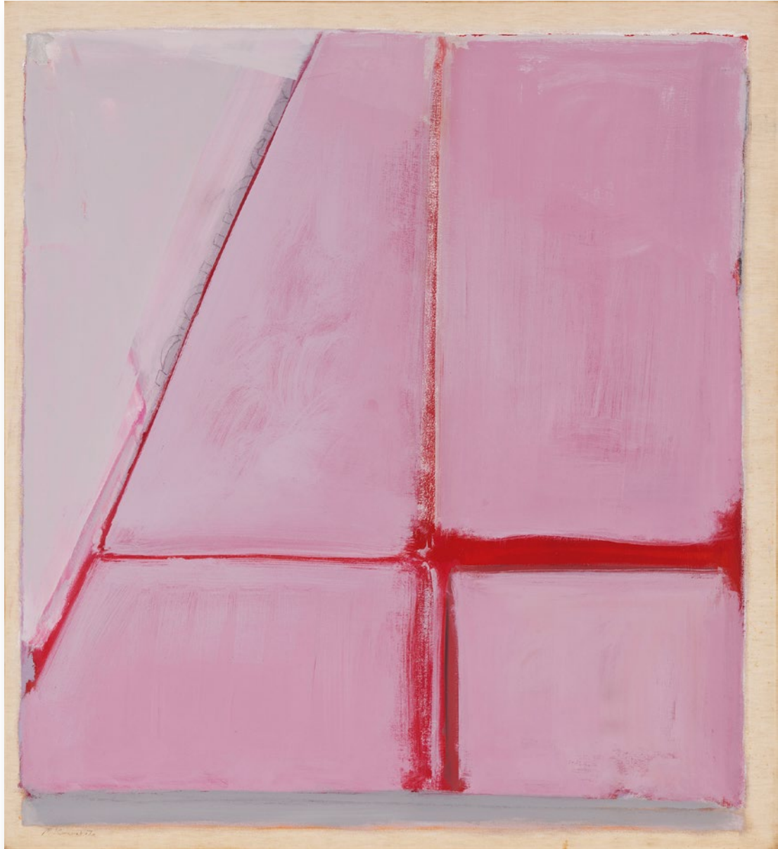
Form Unity No.1 統一体 No.1

1976 / Acrylic on canvas 168.0×152.5cm アクリル