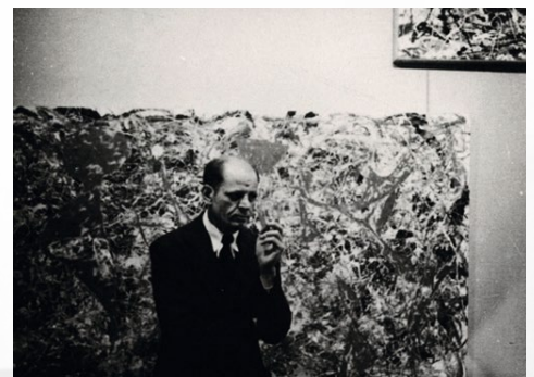
（ベティ・パーソンズ・ギャラリーにて、ジャクソン・ポロック展。 Jackson Pollock at Betty Parsons Gallery for his exhibition. 傑克遜・波洛克展於貝蒂・帕森斯畫廊。）

パーソンズは1940年にウェイクフィールド・ギャラリーでキャリアを開始し、1944年にはモートイマー・ブランド・ギャラリーに迎えられたのち、1946年に独立。以降、アートディーラーとしての活動を本格化させ、ジャクソン・ポロック、マーク・ロスコ、バーネット・ニューマン、ハンス・ホフマンら、当時他のギャラリーから顧みられることの少なかった抽象画家たちを積極的に擁護・紹介したことで知られる。彼女の審美眼と支援は、彼らの評価を押し上げ、抽象表現主義の成立と普及において極めて重要な役割を果たした。