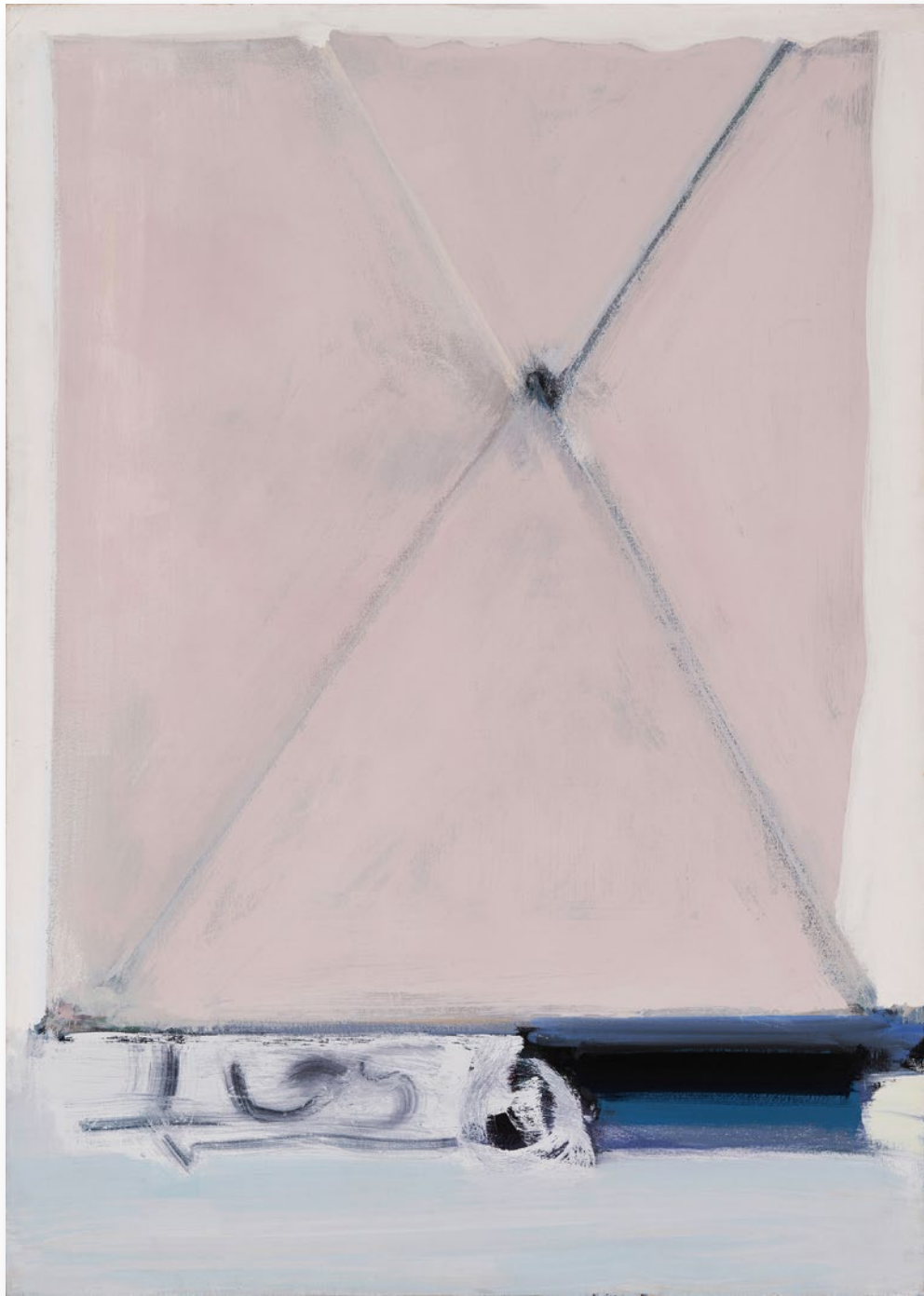
Form Unity (A) 統一体 (A)

1980 / Acrylic on canvas 181.5×130.0cm アクリル