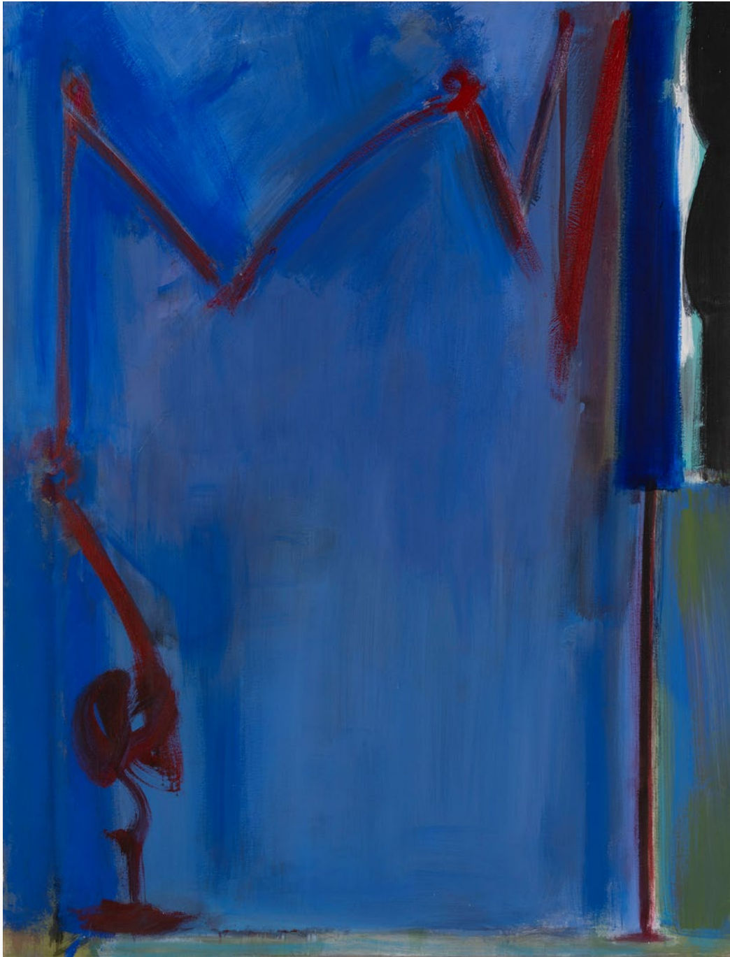
Work 97-E 作品97-E

1997 / Acrylic on canvas 172.3×132.3cm アクリル