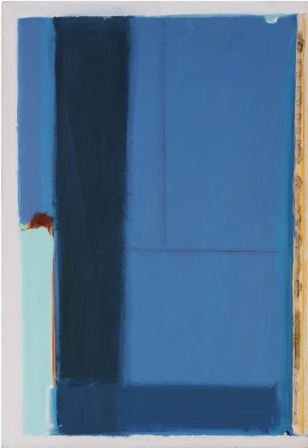
Form Unity No.4 統一体 No.4

1977 / Acrylic on canvas 190.5×132.4cm アクリル