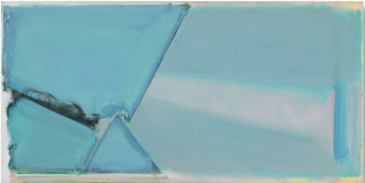
Work M No.2 (Blue) 作品M No.2 (青)

1974 / Acrylic on canvas 76.4×152.7cm アクリル