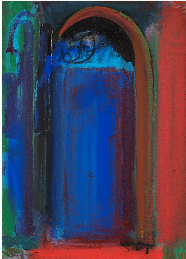
Form 6 フォルム6

1989 / Acrylic and collage on canvas 46.2×33.0cm アクリル、コラージュ