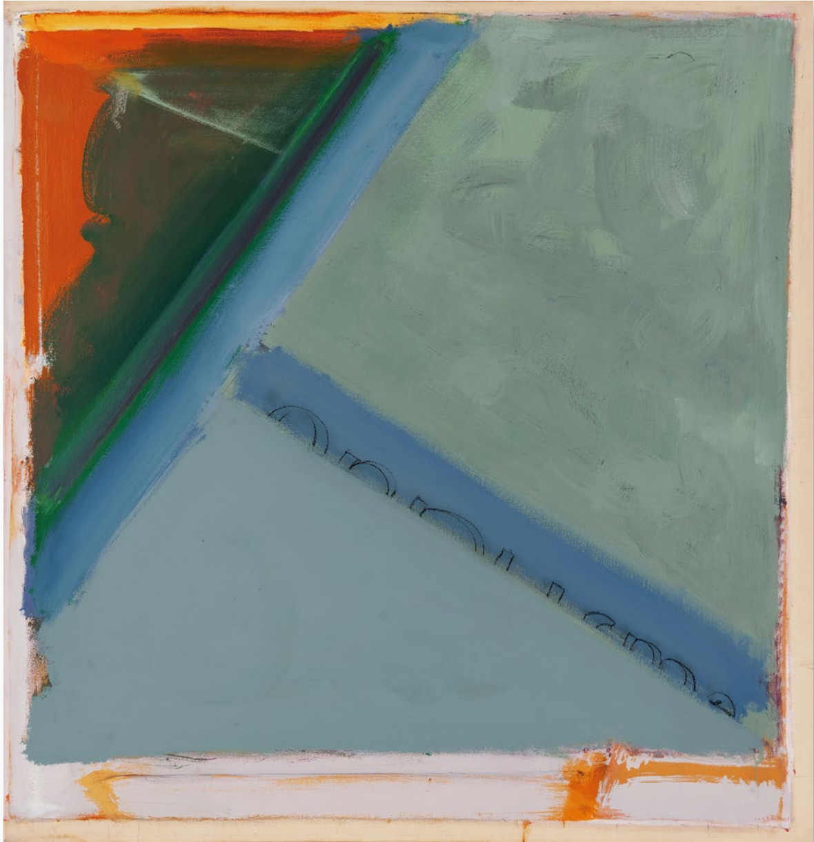
Form Unity No.6 統一体 No.6

1976 / Acrylic on canvas 172.7×168.0cm アクリル