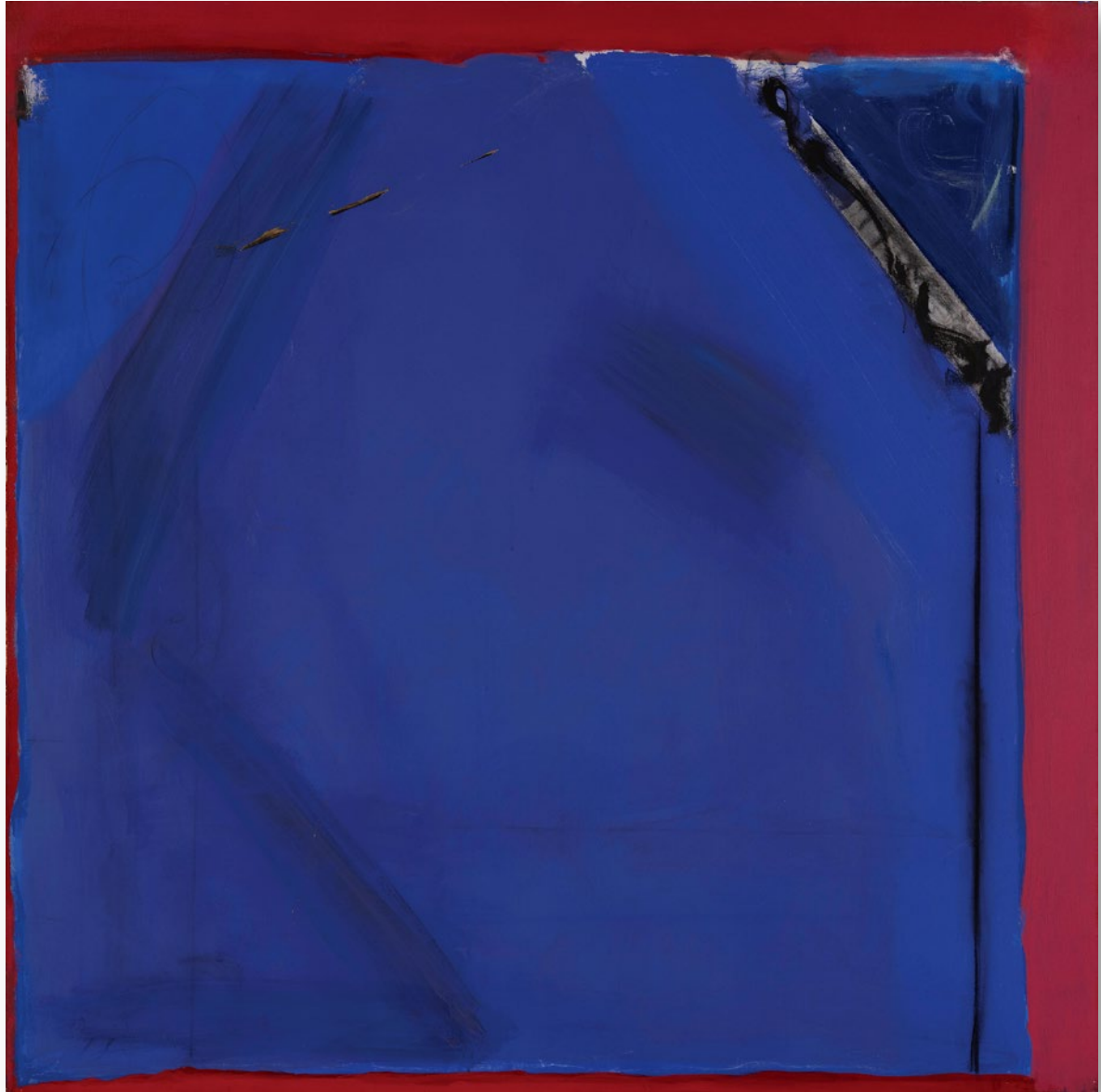
Form Unity No.5 統一体 No.5

1974 / Acrylic and collage on canvas 164.0×164.0cm アクリル、コラージュ