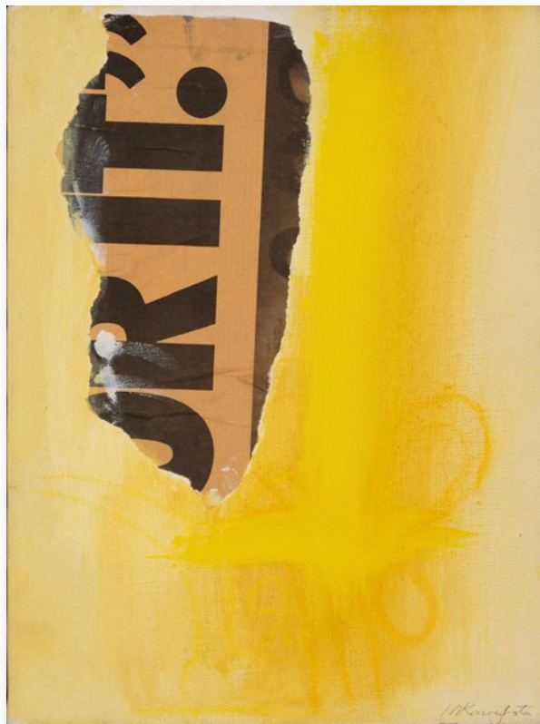
Form 8 フォルム8

1989 / Acrylic and collage on canvas 41.0×30.5cm アクリル、コラージュ