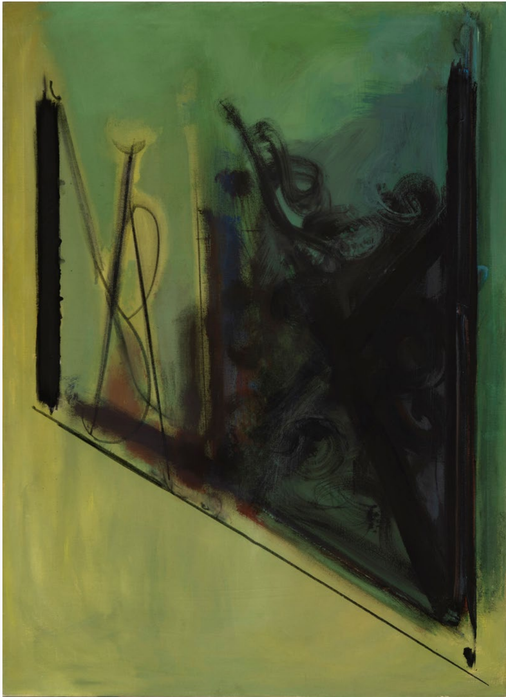
Image from Gate Green 門のイメージ 緑

1987 / Acrylic on canvas 173.0×127.5cm アクリル