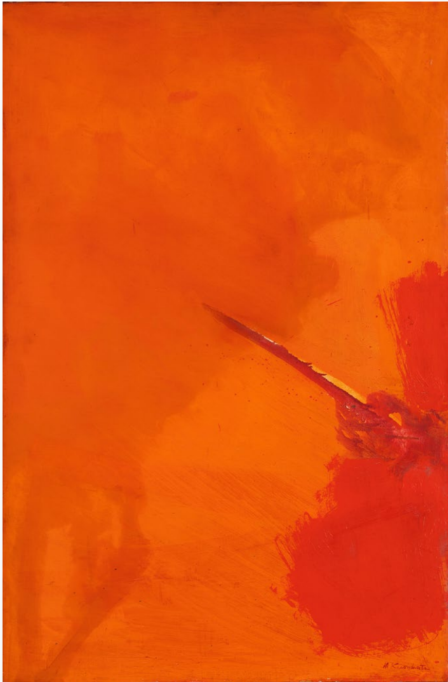
Orange Thurst オレンジの突き